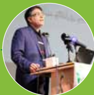
سخنرانی دکتر میر شجاعیان معاون امور اقتصادی وزارت اقتصاد