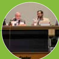
گزارش نشست علمی - سیاستی