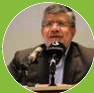
سخنرانی دکتر خسرو تاج رئیس سازمان توسعه تجارت